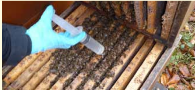
In jede besetzte Wabengasse der Wintertraube muss geträufelt werden!

Nur brutfreie Völker behandeln! Eine Anwendung genügt. Wenn Sie sich nicht sicher sind, wann der richtige Zeitpunkt ist, hören Sie unseren Ansedienst ab oder fragen Sie uns! Die Bruttemperaturfühler in den Stockwaagen des Trachtmeldedienstes bieten eine grobe Orientierung über die Brutstätigkeit der Völker in verschiedenen Regionen und Höhenlagen: www.badische-imker.de oder www.lvw.de .